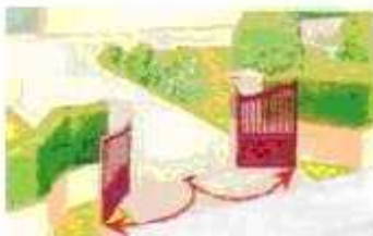
Ouverture battante vers l'extérieur