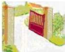
Ouverture sur terrain en pente